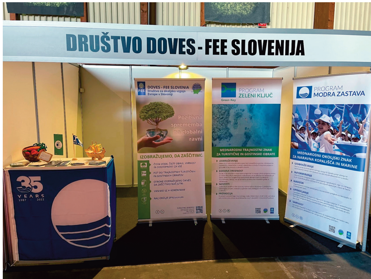
Slika 2: Prikaz razstavnega prostora Društva DOVES-FEE Slovenija

Prav tako se je društvo DOVES - FEE Slovenija predstavilo na sami razstavi.